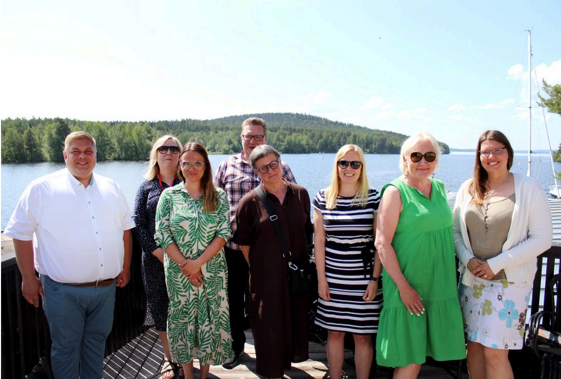
Ohjausryhmä kokoontui Sysmässä 20.6.2023. Osa jäsenistä osallistui etäyhteydellä.